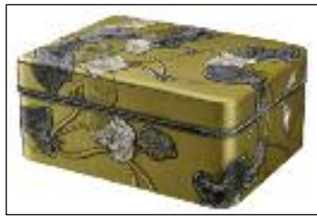
Kosmetikkasten (tebako) mit Kürbisranken, 2. Hälfte 19. Jh., Schwarz- und Goldlack mit Perlmuttereinlagen über Holzkern

wesentlichen Objektgruppen stellt die Ausstellung wichtige Lacktechniken, charakteristische Motive, einzelne Meister und ihre Malereien und Farbholzschnitte sowie japanische Blockdruckbücher vor. Moderne und zeitgenössische Positionen ergänzen die Präsentation der historischen Bestände und zeigen Wechselwirkungen zwischen Lack - Ästhetik und europäischem Design auf. Die didaktisch und sammlungsgeschichtlich aufbereitete Ausstellung möchte die Besucher für die Lackkunst Ostasiens begeistern, leistet aber gleichermaßen einen Beitrag zur Provenienz- und Marktforschung in der ostasiatischen Kunstgeschichte. Die Ausstellung stellt mit über 100 Objekten erste Ergebnisse des von der ZEIT-Stiftung Ebelin und Gerd Bucerius geförderten Projektes zur wissenschaftlichen Erschließung der Sammlung Ostasien vor.