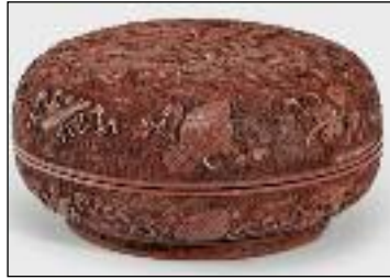
Große Dose mit Drachen und den Attributen der Acht Unsterblichen, China, 18. Jh., Roter Schnitzlack