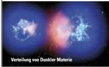
Verteilung von Dunkler Materie