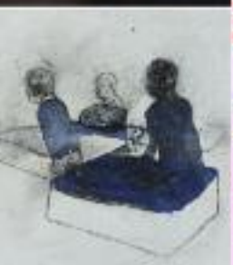
Hamburg - Kursthalle