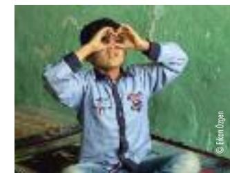
Erkan Özgen: Wonderland (Filmstill), 2016, Bayerische Staatsgemäldesammlungen – Sammlung Moderne Kunst in der Pinakothek der Moderne, München

Unter dem Titel Here We Are Today zeigt das Bucerius Kunst Forum paradigmatische Positionen der künstlerischen Auseinandersetzung mit den zentralen Fragen unserer globalisierten Gesellschaft. Kaum eine andere Gattung der bildenden Kunst greift so unmittelbar aktuelle Themen des gesellschaftlichen Diskurses