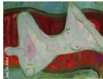
KARL KLUTH (1898-1972) Akt auf rotem Sofa, 1933 Öl auf Leinwand, 75,2 x 100,6 cm