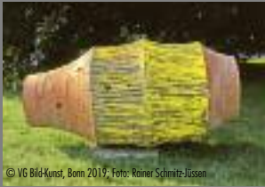
© VG Bild-Kunst, Bonn 2019; Foto: Rainer Schmitz-Jussen

Figur, 1994, glasierte Keramik, 200 x 110 cm, Ausstellungsansicht Hermeshof Rommerskirchen 2000