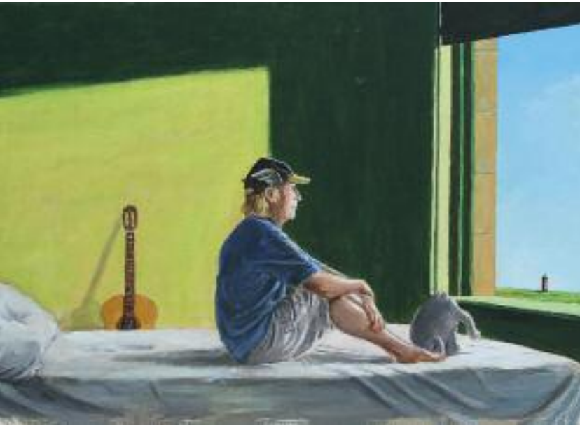
Otto Waalkes (*1948) nach Edward Hopper (1882–1967), Sitting in the Morning Sun , 2018, Acryl auf Leinwand, 60 x 90 cm, Leihgabe der Walentowski Galerien, © Otto Waalkes